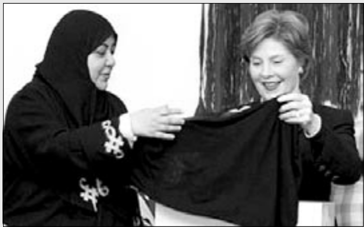
لورا بوش: مطمئنم اگر این را من سرم بکنم، جورج بوش سرم هوو نمیاره؟

گفتم: مگر دقت نکردی هر دفعه نزدیک مغازه طلافروشی می‌شوی مغناطیس‌وار به طرف در مغازه کشیده می‌شوی؟ *** به زخم گفتم: این لوس‌بازی‌های چیه که روی در اتاق خواب علامت ورود ممنوع زده‌ای؟ خیلی ناراحت گفتم: برو توی همان اتاق پایین پای کامپیوتر و اینترنت وقت صرف کن. گفتم: دوست دارم اخبار را دنبال کنم و ببینم در دنیا چه خبره؟ گفتم: پس چرا این گوینده‌های اخبار که همه زن هم هستند لباس تنشان نیست؟ ***