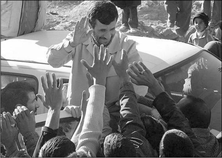
احمدی نژاد: به همه تون آب و برق می‌دهم به شرط این که به کاپشن من دست نزنید!

دفعه اولی که یکی از رفقای قدیمی تازه وارد از ایران مرا به عملیات روبوسی کشاند حساسی قاطی کرده بودم و بعد از بوسه سوم را کنار کشیدم و او با زور بوسه سوم را از لپ من ربود. از آنجایی که به خاطر موقعیت اجتماعی خودم مجبور به یکبار بوسیدن با رفقا و دوستان آمریکایی‌ام هستم و بر طبق عادت روبوسی دو مرحله‌ای را با دوستان قبل از انقلاب انجام می‌دهم، این سه بار بوسیدن حساسی مرا کلافه کرده است. از خودم گاهی می‌پرسم آیا وضع تظاهر و تقیه و چاکرم مخلصم تعارفی در ایران به خاطر عدم اعتماد بین مردم به این روز افتاده که باید بوسه سوم را به فرهنگ ایرانی وارد کرد؟