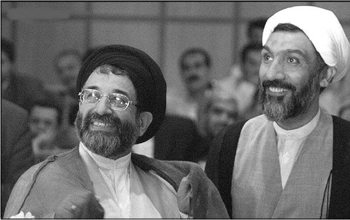
لبخند بزنی! رهبر معظم داره نیگامون می کنه