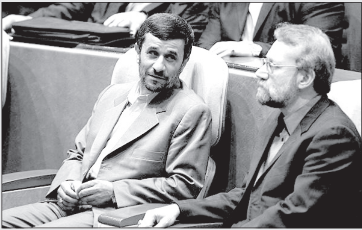
احمدی نژاد: از وقتی رییس مجلس شدی دیگه ما را تحویل نمی‌گیری!