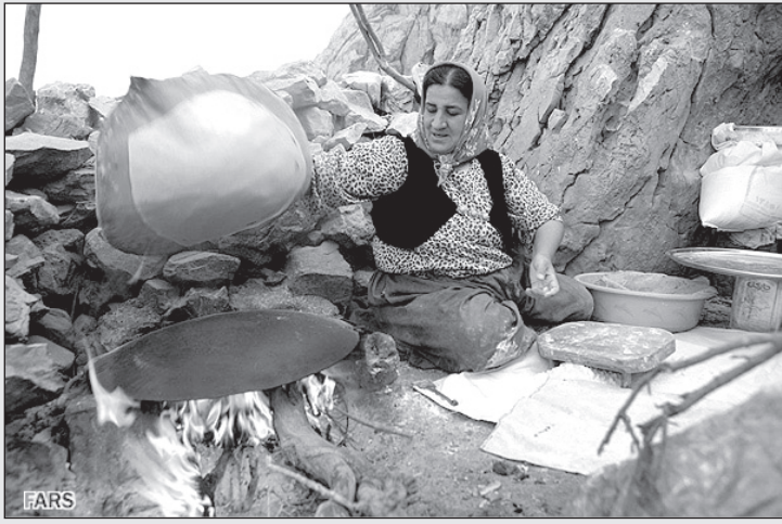
– دست آقای احمدی نژاد درد نکته که به ما تکنولوژی داد!

می‌کنیم که استفاده از این رنگها را فقط محدود به روزهای جشن سده و یلدا و مهرگان و تولد زرتشت نمایند و در بقیه روزهای سال از رنگهای سیاه ویژه اسلامی استفاده کنند! دفتر روابط عمومی، اداره ویژه امر به معروف