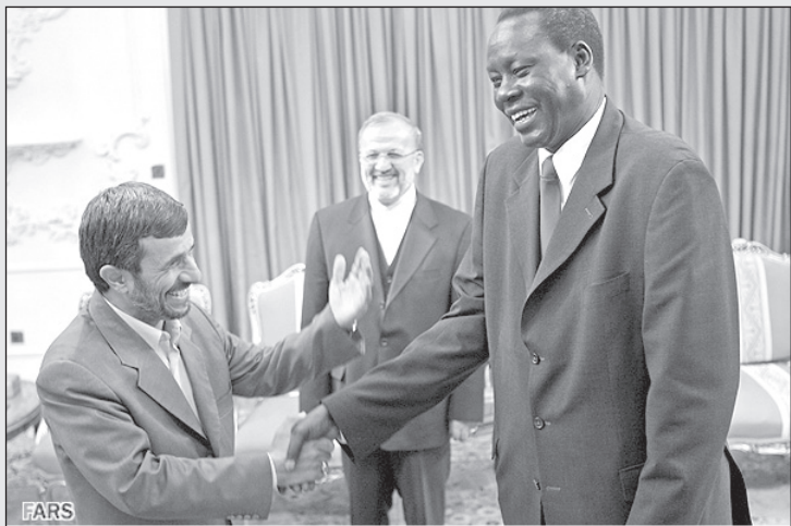
احمدی نژاد: ببین با پول‌هایی که ما تو سودان خرج کردیم ماشاءالله شما چقدر کنده منده شدین!

متذکر شد که علت توقیف این نشریه درج اخباری بوده که به انتقاد از دولت و بزرگ کردن اشتباهات آن مربوط می‌شده است. «شهروند» در خبر مربوط به تورم ۲۸ درصدی دولت احمدی نژاد در یک اشتباه حروف چینی میزان تورم را ۸۲ درصد درج کرده بود!