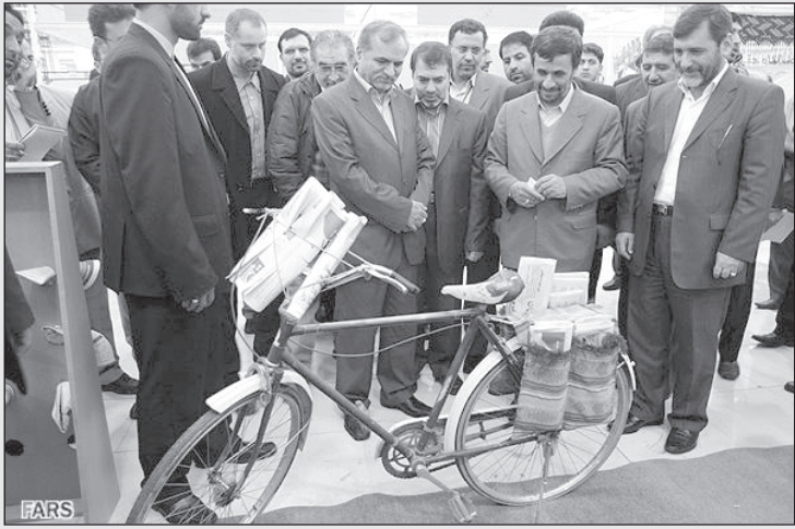
احمدی نژاد در نمایشگاه مطبوعات: فکر می‌کردم تیراژ «کبهان» ما بیشتر از این‌ها باشه!

نقص نداشته و همه چیز را از روی حساب و کتاب درست کرده می‌گویم آیا بهتر نبود به جای دوشیدن شیر گاو از پستان‌هایش خدا یک شیر فلکه کوچک روی بدن آن‌ها قرار می‌داد که باز کنیم و شیر را بگیریم؟ می‌دانید به غیر از این که صنعت لبنیات دنیا کلی پیشرفت می‌کرد خود گاوها هم چقدر بیشتر حال می‌کردند؟ کسی برای دوشیدن دو سه لیتر شیر آن‌ها را اینقدر دستمالی نمی‌کرد و مورد آزار و اذیت جسمی قرار نمی‌داد!