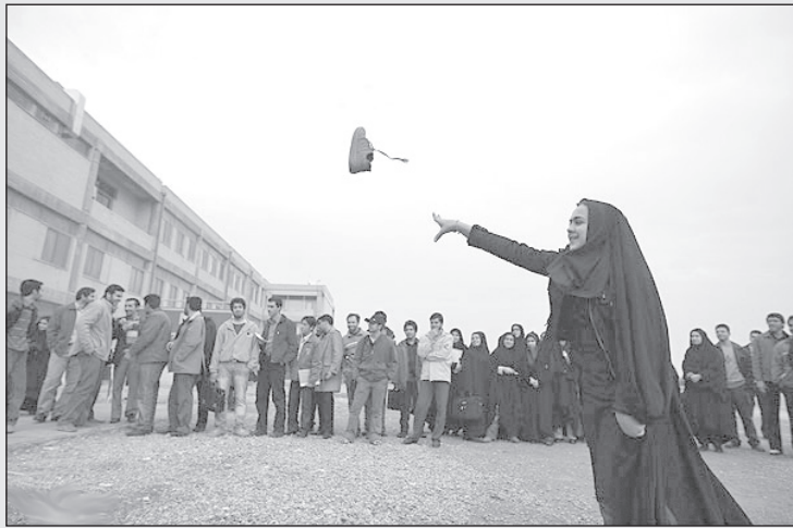
- هر کی این کفش رو تو هوا بقیابه من یک هفته مجانی صیغهش می شم!

این روح درباره جهنم داستان‌های جالبی داشت. او می‌گفت صدای موسیقی بلند از آنجا قطع نمی‌شود. با آن که چند نفر از اهالی بهشت به خدا شکایت کرده‌اند که بعد از ساعت شش بعد از ظهر صدای موسیقی را کوتاه نمی‌کنند خدا جواب درست و حسابی به آن‌ها نداده است.