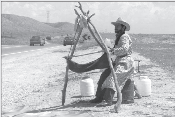
— ما هم اینجا مشغول غنی‌سازی دوغ خانگی هستیم!

می‌کنند، مگر نه؟ چهارشنبه ۹ بهمن: خرها و آدم‌ها پنج شنبه ۱۰ بهمن: من یک کره خر هستم و ۱۵ سال دارم. جمعه ۱۱ بهمن: سکوت خرها شنبه ۱۲ بهمن: حدس بزن چه خری برای شام می‌آید؟ یکشنبه ۱۳ بهمن: الاغ حلقه‌ها، داستان دوستی حلقه‌ها تاریخ نمایش بقیه فیلم‌ها بعدا اعلام می‌شود.