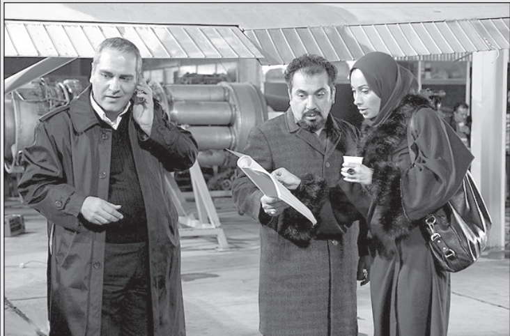
– به آقا بکین خیالشون کاملا راحت باشه، طوری دارم می‌سازم که همه رو بذارم سر کار!

دقیقه قدم زدن تسکین دهم. تمام روز با مرغ‌های دیگر لاس می‌زد و تنها کارش این بود که صبح‌ها قوقولی قو سر دهد و برای صاحب و مدیر مزرعه خودش شیرینی نماید. دیروز با یک مرغ دیگر آشنا شدم. وضعیت مثل من بود ولی کمی بدتر. می‌گفت که خروس او به جای ده مرغ با ۱۵ مرغ می‌پرد و جدیداً حتی به جوجه‌های کوچولو هم نظر پیدا کرده است. مرتیکه منحرف! خیلی با هم حرف زدیم. از او پرسیدم: من برای چه خلق شده‌ام. برای تمتع جنسی این خروس‌ها و بعد پخ پخ؟! این اصطلاح پخ پخ اصطلاح خیلی چندش‌آوری است. به این اصطلاح می‌شود که وقت کشتن مرغ فرا رسیده و باید به سالن‌خانه رفت. وقتی می‌خواهی مرغ دیگری را بترسانی یواشکی می‌روی پشت او و بعد با صدای بلند فریاد می‌کنی: پخ پخ! زهره‌شان می‌ترسد و از ترس دو سه ساعت دور مرغدانی می‌دوند و قد قد می‌کنند!