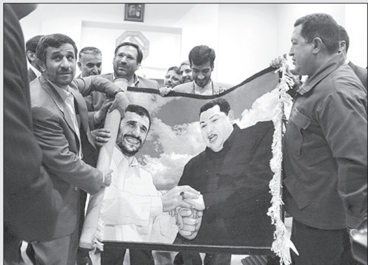
احمدی‌نژاد: نکته دارین شوخی شوخی ما رو به دست خودمون لوله می‌کنین میذارین کنار!

گفت: با آن که از کاندیدا شدن کنار کشیده‌ام ولی در صحنه حضور دارم. او توضیحی درباره این صحنه نداد و اضافه کرد: اگر مردم بخواهند دوباره به صحنه باز خواهیم گشت. خاتمی گفت: بعید نیست که حتی روز بعد از انتخابات خودم را کاندید کنم!