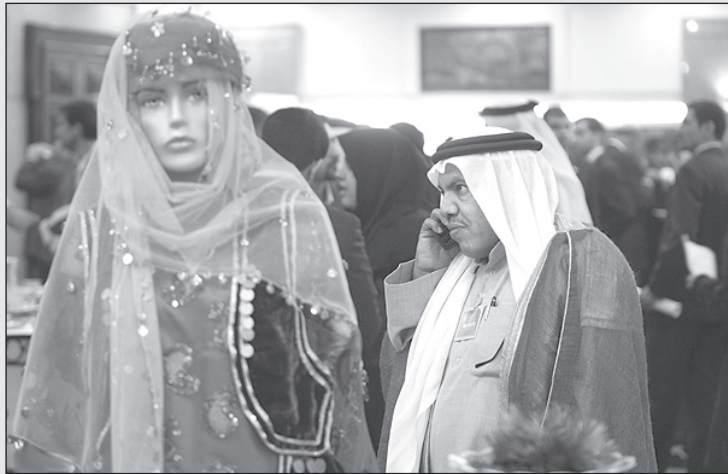
– الو، حاج آقا! می‌خواستم بدونم فتوای آقا در مورد صبیغه موقت مانکن چیه؟

– مشکل شما با آمریکا چیست؟ – آمریکا باید از گذشته درس بگیرد. – شما چی؟ – ما نه. – چرا نه؟ – ما درسمان را جای دیگر می‌خوانیم. ما ۳۰ سال است که تحت فشار آمریکا قرار داریم. – می‌خواستید گروگان نگیرید. آن‌ها را ۴۴۴ روز نگه داشتید. روحیه مردم آمریکا نسبت به شما عوض شد. – ما هم هشت سال مورد حمله عراق بودیم. آمریکا و اروپا هم از صدام حمایت کردند. کشور شما هم بیشتر از بقیه طرف صدام را گرفت. البته ما آلمانی‌ها را دوست داریم. – شما می‌خواهید آمریکا چکار کند؟ معذرت خواهی کند؟ نامه بنویسد؟ – نه آقا. نامه را که نمی‌شود به بانک برد و نقد کرد. – شما می‌خواهید آمریکا از عراق و افغانستان بیرون برود؟