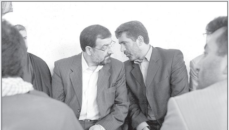
– آقا محسن، بچه‌ها خبر دادند که نطق احمدی‌نژاد در سوئیس خیلی ضایع بوده و آپروریزی کرده. فکر می‌کنم اگر حالا شما کاندید بشوید شانسش پیروزی دارید!

گفت: ساکت باش دارم فیلم تماشا می‌کنم! * زنم گفت: شوهر همسایه هر روز که سر کار می‌رود زنش را جلوی در خانه می‌بوسد. تو چرا این کار را نمی‌کنی؟ گفتم: یکبار این کار را کردم شوهرش از راه رسید و گندش در آمد! * به زنم گفتم: از زمانی که من با تو ازدواج کرده‌ام تغییری در من دیده‌ای؟ گفت: اگر ۲۰ کیلو چربی و کله طاست را حساب نکنم اصلا و ابدا!