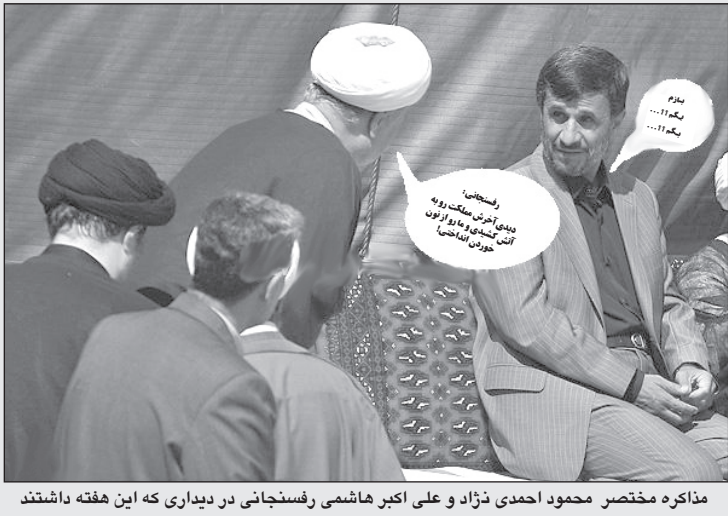
مذاکره مختصر محمود احمدی نژاد و علی اکبر هاشمی رفسنجانی در دیداری که این هفته داشتند