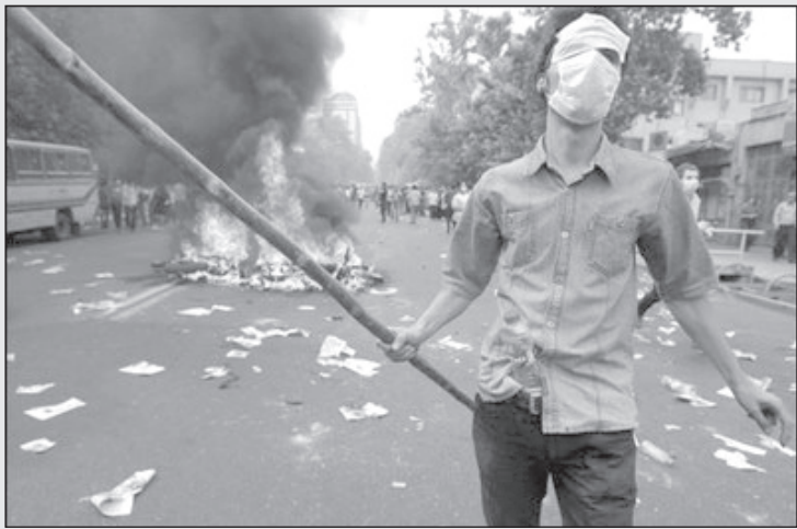
جوان ایرانی: بچه‌ها بیابید دوباره چهارشنبه‌سوری شده بدون مزاحمت نیروی انتظامی!

از سرکوب‌های خیابانی شما معروف شده و مخصوصا در کشورهای غرب همه رنگ سبز می‌پوشند. نماینده: این نشان دهنده این است که انقلاب ما بالاخره به مرحله صادرات رسیده است!