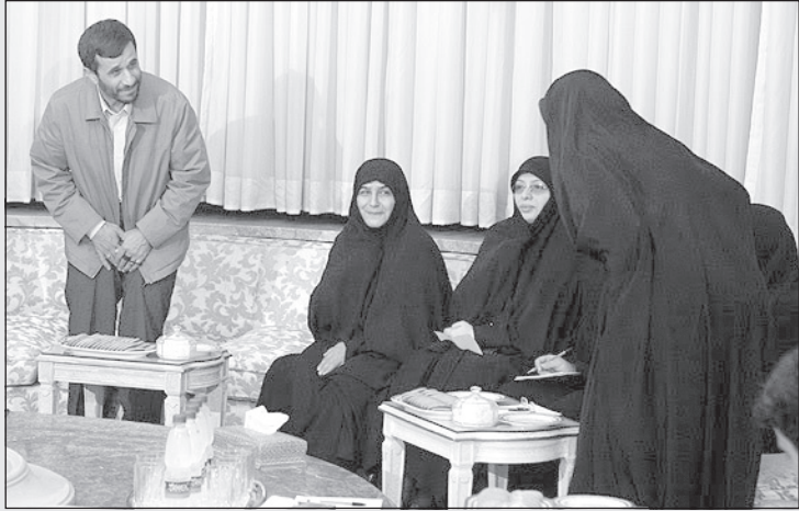
احمدی نژاد: ببخشید خواهر، این چادر شما حسابی مرا تحت تاثیر قرار داده!

دیر شده... لبخندی زد و صورت پر از چین و چروکش دهها چین بیشتر گرفت. از زمین بلند شد. زانویش درد می‌کرد. به طرف قفس رفت و از جیبش یک مشت تخمه آفتابگردان در آورد و توی قفس جلوی طوطی ریخت.