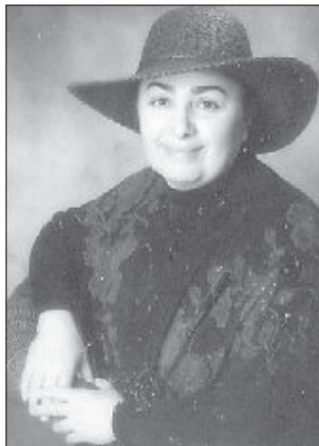
«پژوهشگر»: هما ناصری

این کتاب را همه باید بخوانند: نیمه بها برای بازنشستگان کم درآمد: شبپینگ مجانی