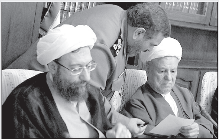
این را آقا فرستاده و تاکید کرده که مصلحت نظام اینه، نه اونیه که شما می‌گویید!

روانکاو و روانشناسی به بیماران عزیز و محترم می‌باشد.