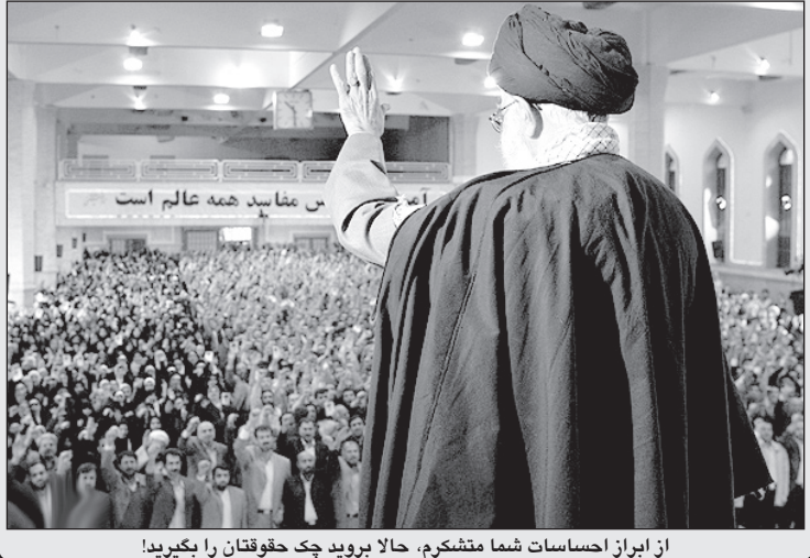
از ایران احساسات شما متشکریم. حالا بروید چک حقوقتان را بگیرید!

خبر داد و گفت که از سال آینده این پروژه در سر تا سر مدارس ایران اجرا خواهد گردید. او گفت: قرار بود در کتاب‌های درسی مونث همه دخترها و زن‌ها بدون روسری و چادر باشند چون طبیعتاً فقط دختران به این کتاب‌ها رجوع خواهند کرد اما بعد نظر خود را عوض کردیم. او اضافه کرد: حساب کردیم چون در ایران دختران و پسران به خاطر تفکیک جنسی بسیار احساس محرومیت جنسی می‌کنند ممکن است کتاب‌های یکدیگر را دید بزنند و ما دوباره به نقطه اول برگردیم. وی به استناداران هشدار داد که نباید اجازه دهند کتاب‌های دخترانه به عنوان نوعی مجله «پلی‌بوی» توسط پسران مورد استفاده قرار گیرد.