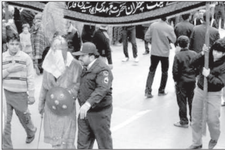
آخرین خبر از روز عاشورا: امام حسین توسط نیروی انتظامی تهران دستگیر شد!

عصبانی شد و گفت: به شما چه؟ گفتیم: می‌خواستیم بیرسم چرا رفتید توی خیابان؟ شنیده‌ام به شما آب میوه ساندیس و بیسکویت و کادوهای دیگر داده‌اند که این کار را نکنید. پرسید: شما از کجا می‌دانید؟ گفتیم: عکس‌هایش را داریم. کمی سکوت کرد. پرسیدم: شما چه آدمی هستید که به نفع این آدم‌ها که سی سال مملکت را گذاشته‌اند سر کار می‌روید توی خیابان؟ واقعا خجالت دارد. طرف کمی شرمند شد و من و من کرد و بعد از روی ناچاری فریاد کشید: به شما چه ربطی دارد؟ من تا آخرین قطره ساندیس برای رهبرم می‌جنگم!