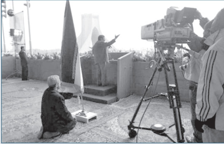
احمدی نژاد: در دولت جدید با همت مضاعف اشتغال ایجاد خواهیم کرد!

دیگر برای آن دیگری ولی هیچ کس برای هردوی آن‌ها گریه نکرد.