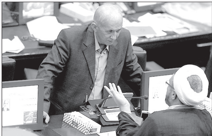
بهترین درمان برای سر کچلت این است که آخوند بشوی و عمامه بگذاری!

توصیه کرد که بجای استفاده ابزاری از مسایل دیگر کشور به ابهامات و سئوالات در مورد نقض حقوق بشر در این کشور پاسخ دهند! گویا کاردار موقت این کشور در تهران یادداشت کوچکی به وزارت امور خارجه ایران فرستاده با عنوان: ها... ها... ها... و زیر آن نوشته: شوخی می کنید مگر نه؟