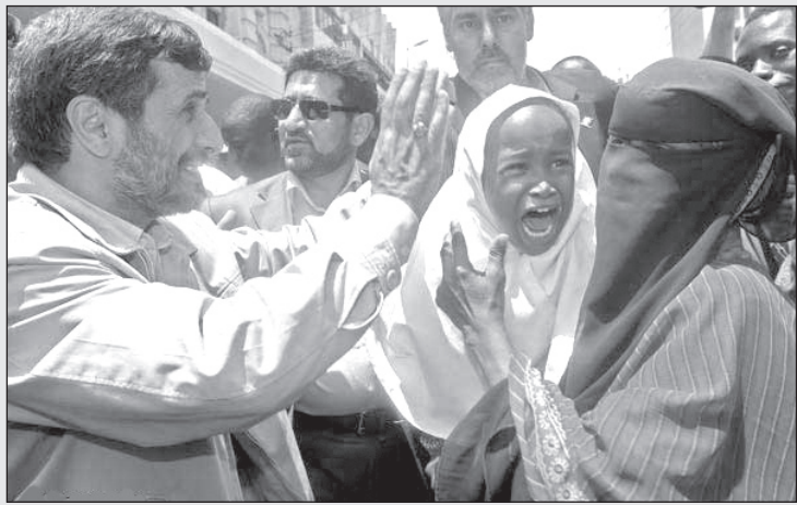
مادر قربونت بره، این آقا لو لو نیست... گریه نکن!

روز بعد: همان راننده دنبال من آمد که به محل کنفرانس برویم. یک نفر دیگر هم با او بود. از لباس شیک مارک آرمانی او فهمیدم که لباس شخصی است. پرسید: اشکالی ندارد که به شما چشم‌بند بزنیم؟ با تعجب پرسیدم: چرا؟ گفت: این رسم ما است. ما با همه مهمان‌های خارجی اینجوری رفتار می‌کنیم. بهتان برنخورد! حدود ساعت دو بعد از ظهر بود که به یک جایی رسیدیم. لباس شخصی گفت: به علت مسایل امنیتی محل کنفرانس و همایش را تغییر داده‌ایم. وقتی که چشم‌بند را باز کرد خودم را در سالن بزرگی دیدم پر از جمعیت. نیمی از افراد شرکت کننده را نمی‌شناختم. از بوی بد بدن آن‌ها و لباس‌های گشاد و بی‌قواره آن‌ها حدس زدم آدم‌های خودشان هستند و قاطی ما ایرانیان خارج از کشور شده‌اند. ساعت پنج بود که هنوز برنامه همایش شروع نشده بود.