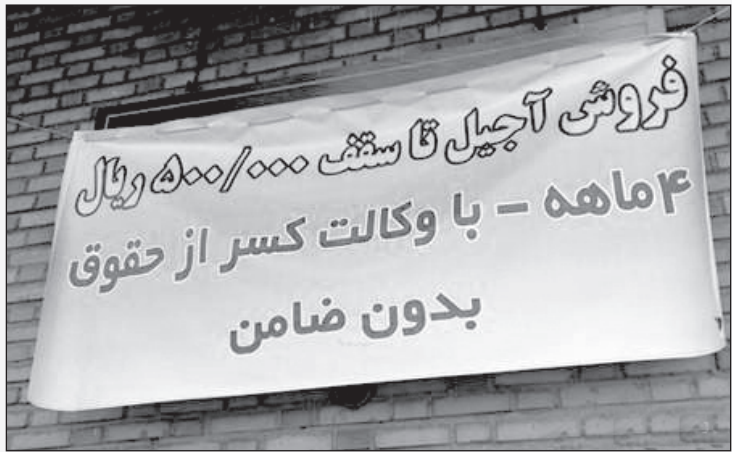
وضع اسفناک قیمت آجیل بعد از اجرای طرح یارانه‌های احمدی‌نژاد!