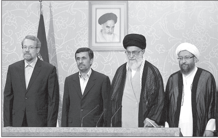
فیلم روز تهران: ۱۲ مرد خبیث! (۸ نفر بقیه برای گرفتن عکس حاضر نشدند)

الکی دیگر از شرکت در این مسابقات بین‌المللی! انصراف دادند.