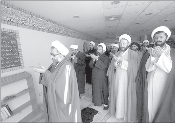
خدایا! کاری کن تنگه هرمز بسته نشود و نان ما آجر نشود!