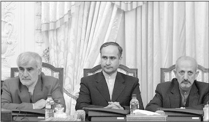
در کنفرانس بین‌المللی «پیوند مو» که در تهران برگزار شد، سه نوع مختلف کچلی توسط نمایندگان ایران به شرکت کنندگان ارائه گردید!