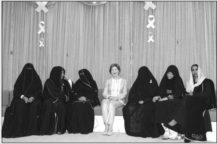
لورا بوش: در جمع این خانم‌ها نمی‌دانم چرا احساس برهنگی می‌کنم!