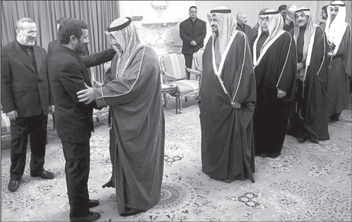
احمدی‌نژاد موقع گرفتن این عکس گفت: یک لحظه فکر کردم عرب‌ها باز به ایران حمله کرده‌اند!

طالبان و بن‌لادن پرچمداران این حرکت هستند و آدم‌های دیگر مثل احمدی‌نژاد و جنتی و حسین شریعتمداری هم توی دست و پایشان وول می‌خورند و سنگ این «یتیمیایی» خیالی را به سینه می‌زنند.