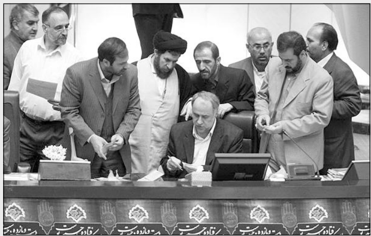
آقا به ما هم چند تا اسم از لیست زن‌های آماده برای صیغه بدهید!