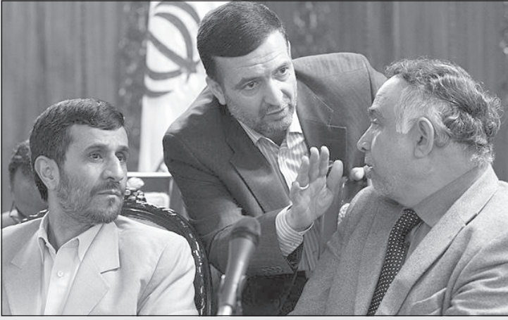
مشاور احمدی نژاد در سفر به عراق: هر سؤالی دارید بپرسید ولی درباره هاله نور سازمان ملل نباشد!

چون تا این مطلب چاپ بشه تاریخش با امروز فرق خواهد کرد، از نوشتنش گذشتم، حیف شد. مطلب جالبی بود!