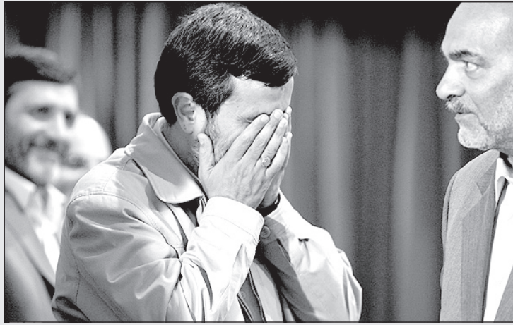
احمدی نژاد: این قیمت گوجه فرنگی مرا دیوانه کرده است!