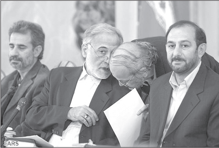
ببین، با این نوع کچلی که تو داری پیشنهاد می‌کنم روحانی بشوی و عمامه سرت بگذاری. آیا کشتی