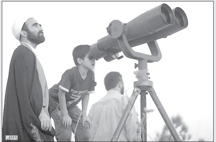
— بچه جان، بجنب! هلال ماه رو زودتر پیدا کن؛ دیگه حال روزه گرفتن ندارم!

تا لامپ سوخته را به عنوان این که استفاده نشده ولی سوخته بوده پس بدهد و لامپ مجانی جدید به جایش بگیرد!