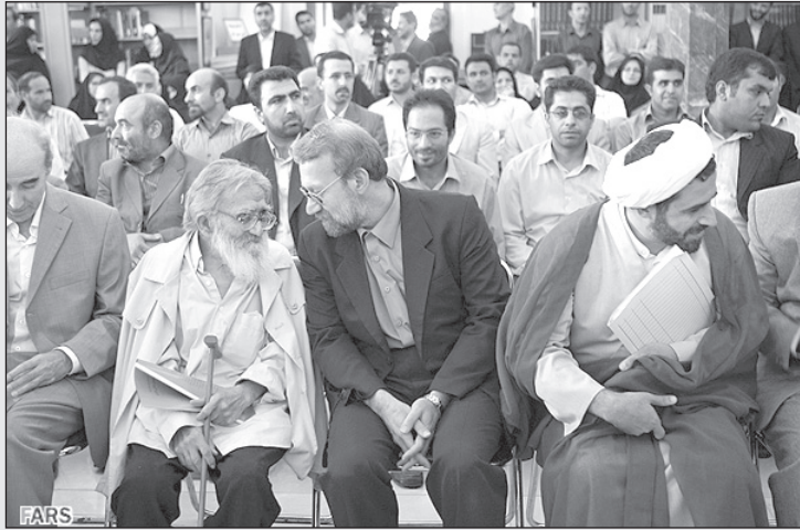
لاریجانی: جدی میکی که فقط ۲۵ سال داری و انقلاب تو رو به این روز انداخته؟! (FARS)

نظری دارید؟ - گوشه دستت... این بچه حسابی معده‌اش به هم ریخته. وای چه بویی؟! - الو؟ درباره چه چیزی صحبت می‌کنید؟ - بچه به این کوچکی بین چکار کرده؟ باید بروم پنجره را باز کنم. یک دقیقه گوشه دستتون. - الو؟ - بله برگشتم... سؤالتان چه بود؟ - مهم نیست. بعدا زنگ می‌زنم! * الو؟ - بله. - این مسیح چیه فرستادی؟ - کدوم مسیح؟ - این که میگه ها ها ها. - جوک فرستاده بودی جوابش را دادم. - جوک‌ها را دو هفته پیش فرستادم چطور شد که امروز به دست رسید؟ - کارمندهای اداره مخابرات سواد درست و حسابی ندارند دو هفته طول کشیده که بخوانند و بعد بفرستند توی خط‌ها! - ها ها ها... * الو؟ - بفرمایید... - داریم آمارگیری می‌کنیم. میشه چند تا سؤال از شما بپرسیم؟ - آمار چی؟ - راجع به ریاست جمهوری و میزان رضایت شما. - وقت ندارم باید بروم پوشک بچه‌ام را عوض کنم. - خیلی کوتاه و مختصره. وقت زیادی نمی‌گیره. - موبایل مرا از کجا گیر آوردید؟ - از وزارت کشور. - منظورت مخابراته؟ - نه وزارت کشور. - راجع به چی سؤال دارید؟ - این که از رهبری دکتر احمدی‌نژاد چه برداشتی دارید؟ در مورد اوضاع مملکت چه