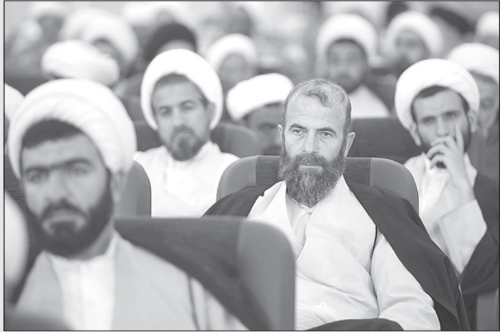
- باید عمامه ام را قبل از این که خشکشویی می بست می گرفتم.

دوستان و آشنایانی که موفق به خداحافظی از آن‌ها نشدم پوزش می‌طلبم. همچنین مراتب تشکر خود را از دریافت هدایا و کادوهای دوستان و آشنایان بنیادگرا که جهت دکوراسیون خوابگاه اینجانب در دانشگاه آکسفورد مرحمت کرده‌اند اعلام می‌دارم.