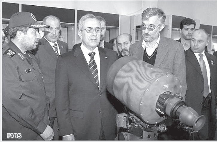
- این اسلحه جدید را با الهام از آفتابه‌های خودمان ساخته‌ایم!

می‌گویند برای همین است که او با مردم قزوین کاری نداشته و شهر آن‌ها را بی‌صدمه ترک می‌کند اما از مردم شهر کرمان که او خواهر بودن او را مسخره می‌کردند انتقام سختی می‌گیرد و چشم اهالی شهر را تا وزن ۷۰ من از حدقه در می‌آورد (البته آن موقع ترازوی دقیق هم نبوده تا این عدد تایید شود).