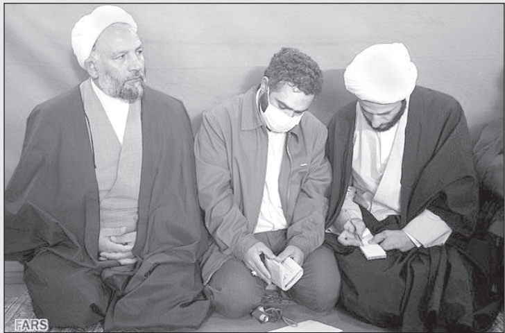
– بله حاج آقا، به دستور آقا عمل کرده‌ام که انتقاد را تا انتخابات سال آینده ممنوع اعلام کرده‌اند!

و یا به حالت نیمه تعطیل در آورده‌اند. طبق تخمین سازمان‌های مطالعات اقتصادی امروزه حدود بیست میلیون کارگر در سرتاسر جهان از کار بیکار شده‌اند. دوستان چپگرا و کمونیست باید خوشحال باشند که بالاخره کارگران دنیا با داشتن یک وجه مشترک توانستند به اتحاد کامل با یکدیگر برسند. این وجه مشترک فقط یک چیز است: بیکاری!