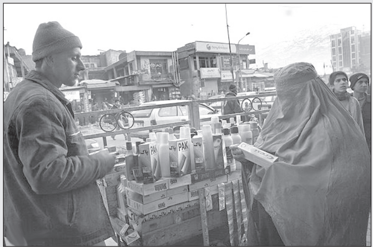
آبجی کسی که ندونن های شما رو نمی بینه، واسه چی پولت رو حروم خمیردندون می کنی!

تلفنی من با هموطنان در ایران ناشی از بیماری مردم آزاری نیست بلکه چون این رفیق ما کارت تلفن مجانی به ایران به من داده راه دیگری برای وقت کشی برای من باقی نگذاشته است (به جز شوخی با هموطنان داخل کشور) و مجبورم که این کار را انجام دهم.