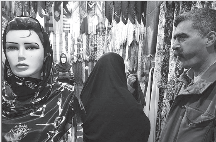
- دارم وسوسه میشم زخم رو اینجا ول کنم، این خانوم مانکن رو بردارم ببرم خونه!