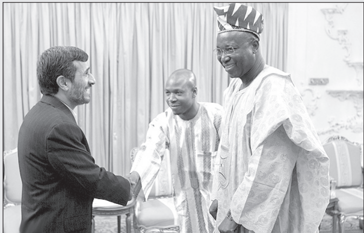
احمدی نژاد: اکه بچه‌های گشت ارشاد شما رو توی خیابان‌های تهران با این شکل و شمایل ببینم درجا دستگیرتون می‌کنن!