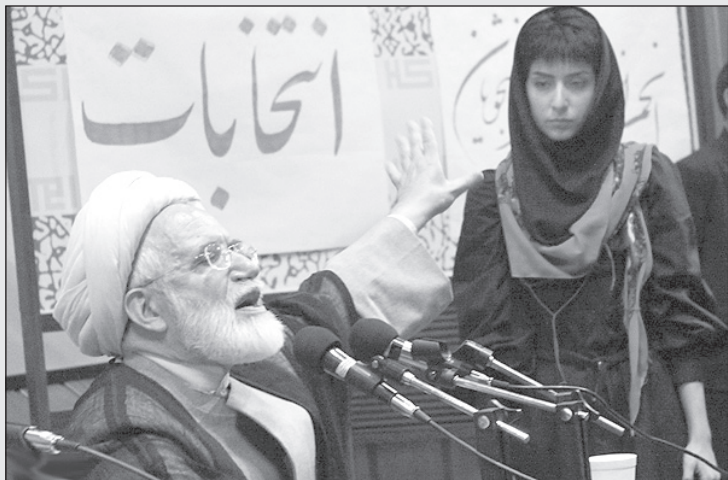
کروبی: اگر مرا انتخاب کنید از این خانم یک «باربی» خوشگل درست می‌کنم!