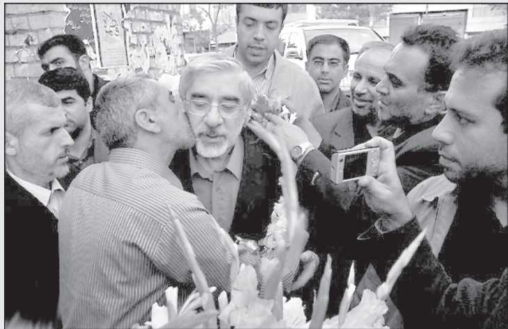
میرحسین موسوی: بابا من گفتم اصلاح طلب هستم ولی نه جلوی مردم!

- خب من چکار باید بکنم؟ - تنها کاری که باید بکنید این است که به یکی از دهات و قصبه‌های کوچک ایران نقل مکان کنید! - بله؟ - این پول عیدی برای دهاتیان نقاط محروم است. شما باید از تهران بروید و مدتی در دهات اقامت کنید. - برو آقا! - پول بدی نیست. از دود و ترافیک هم مدتی دور می‌شوید. شاید هم خوششان آمد و ماندگار شدید. - من برم دهات زندگی کنم که ۶۰ هزار تومان بگیرم بیاد؟ اگر ۶ میلیون یا ۶۰ میلیون بود یک حرفی. با ۶۰ هزار تومان دو کیلو گوجه هم به آدم نمی‌دهند. - خیلی خوب چونه زنید. با ۸۰ هزار تومان موافقید؟ در ضمن حرف سیاسی زنید. - برو آقا دلش خوشه! - اگر موافقت کنید می‌تونم ترتیبی بدهم که بقیه در صفحه ۳۳