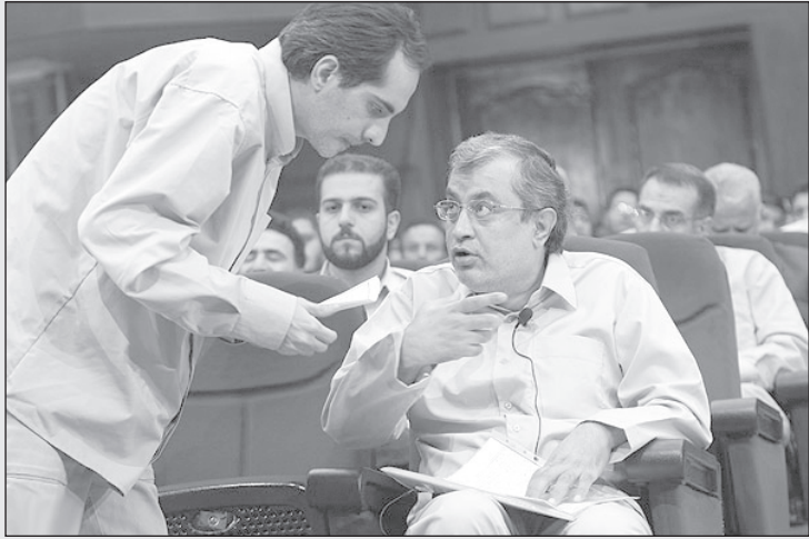
حجاریان: بازم باید بیام کتک بخورم؟ ولی توی زندان سهمیه‌ام رو گرفته بودم!

رسیده است یا نه. پاره‌اش می‌کنی و می‌بینی هنوز کال است و مزه خیار و کدو می‌دهد. یا می‌گذاری کنار که کمی بیشتر برسد و تا می‌جنبی می‌بینی طالبی بگه‌ها از رسیدن گذشته و به مرحله خراب شدن و گندیدن رسیده است. واقعا بهترین زمان برای خوردن طالبی چه وقتی است؟ آن زمانی که طالبی نه کال است و نه زیاد رس. من خود بسیاری اوقات طالبی می‌خرم و طالبی‌ام بگه‌ها ساعت مثلا دو بعد از نیمه شب آماده خوردن می‌شود. اگر نخوری از جیبیت رفته و اگر صبر کنی روز بعد طالبی بوی گندیدگی گرفته است. من طالبی‌هایی را که بعد از ظهرها می‌رسند خیلی دوست دارم. انار را نگاه کنید برای دو سه قاشق آب انار خوردن باید نصف روز وقت بگذاری و دانه‌های آن را از پوست و حجره‌های کوچکش بیرون بیاوری. آیا انار را شیطان طراحی کرده تا به بشر بخندد؟ هلو را نگاه کنید. تا می‌آیی حال کنی یک چیز سفت و گنده می‌آید توی دهن. اگر از قبل بهت نگفته باشند که وسط این یک هسته است ممکن است همه دندان‌هایت را از دست بدهی.