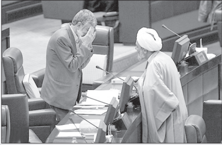
حدا عادل: روز بعد از ۱۳ آبان اینجوری رفته به دست بوس رهبر!

زیادی برای ایرانیان داشته است و این که جنبش زودتر و یا دیرتر به نتیجه مطلوب برسد دیگر مهم نیست و اصل جنبش مطرح شده و به راه افتاده است. برخی از فواید جنبش سبز را می‌توان چنین عنوان کرد: