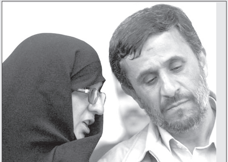
همسر احمدی نژاد:

ببین محمود، ایندفعه که رفتیم مسافرت خارج چند دلار از پول لبنانی‌ها را بده من بخرده خرید کنم!