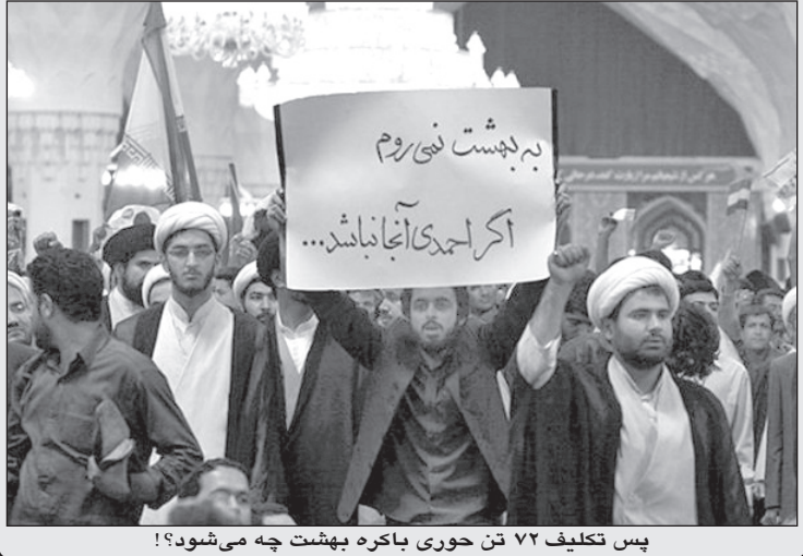
پس تکلیف ۷۲ تن حوری باکره بهشت چه می‌شود؟!

رییس دادگاه: برای چی؟ متهم: رفته بودم زیارت! رییس دادگاه: رفته بودید زیارت؟ چرا رفتید به اردوگاه اشرف؟ متهم: رفته بودم برادرم را زیارت کنم. سال‌ها ندیده بودم. وقتی بچه بودم رفت. رییس دادگاه: آیا درست است که به صورت غیر قانونی از کشور خارج شدید؟ متهم: چون می‌خواستم بروم شهر اشرف به من از طریق قانونی پاسپورت نمی‌دادند. رییس دادگاه: در آنجا چکار کردید؟ متهم: کاری نکردیم. با برادرم بودم و دو سه بار رفتیم کنسرت خانم مرضیه. رییس دادگاه: آیا از شما خواستند جاسوسی کنید؟ متهم: نه گفتند عکس و فیلم بگیر و برایمان بفرست. نگفتند جاسوسی کن. رییس دادگاه: برای چی؟ متهم: چون خودشان نمی‌توانستند در ایران فیلم و عکس تهیه کنند. بقیه در صفحه ۳۳