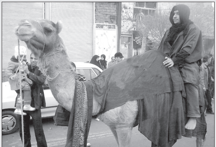
برخی از بسیجی‌ها دیکه از موتورسیکلت در سرکوب مردم استفاده نمی‌کنند!

این رقم احتمالا بسیار کمتر خواهد بود مگر این که این مطلب را بعد از تحویل سال نو بخوانید!