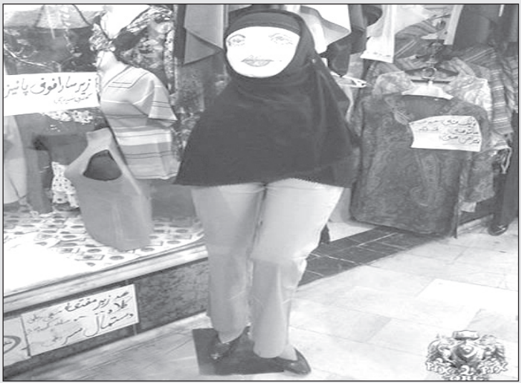
وقتی نمایش اندام مانکن‌ها در تهران ممنوع می‌شود!