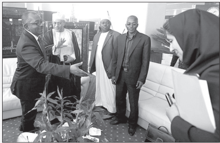
خانم ایرانی در اجلاس کشورهای غیرمتعهد در تهران: خاک عالم با یک مرد دست بدهم؟ آن هم با یک کاکا سیاه!؟